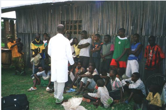
Voorlichting over aidspreventie