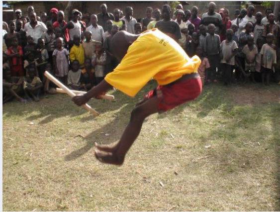
'Buiging voor de koning'