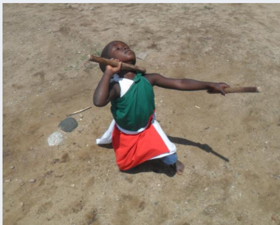
'Trouw zweren aan de koning'