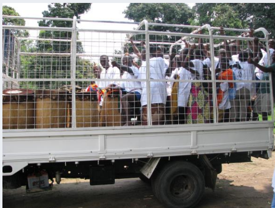
La Fourgonnette 2007- 2016